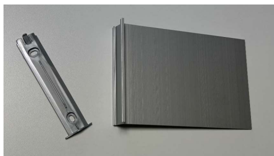
Livré en 2 parties : la platine plastique et le drapeau aluminium (livré sans visserie).

Possibilité de fabrication sur mesure : quantité minimum 10 pièces largeur maxi 160mm, hauteur mini 110mm.