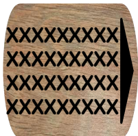
SEB150-224 9 caract. max