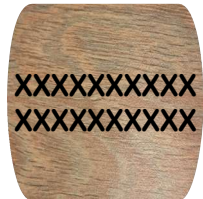
SEB150-202 10 caract. max