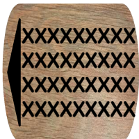
SEB150-214 9 caract. max