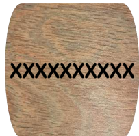
SEB150-201 10 caract. max