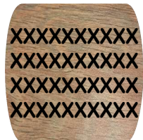
SEB150-204 10 caract. max