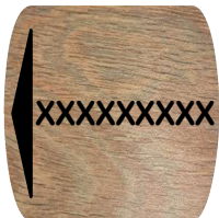
SEB150-211 9 caract. max