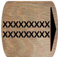
SEB150-222 9 caract. max