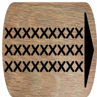
SEB150-223 9 caract. max