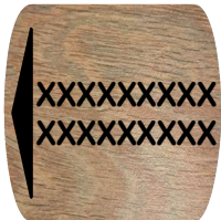
SEB150-212 9 caract. max