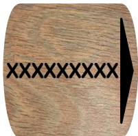
SEB150-221 9 caract. max