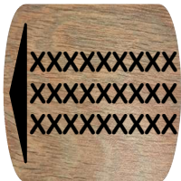
SEB150-213 9 caract. max