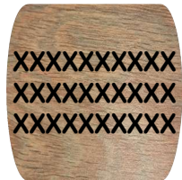
SEB150-203 10 caract. max